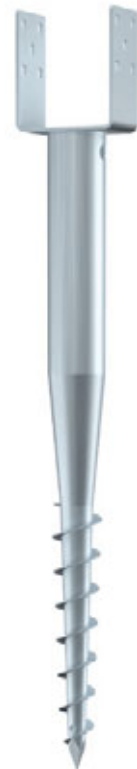
KSF U 66x 730-111

Eindrehstange kurz 0,60 kg Art.-Nr. 20070